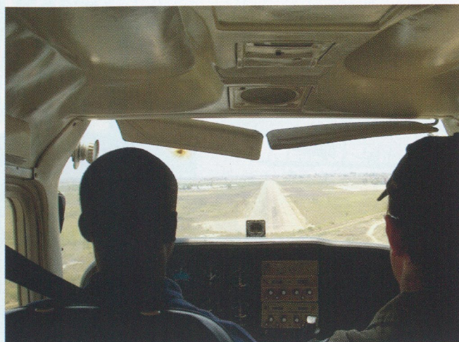
Aterragem em Cessna 172