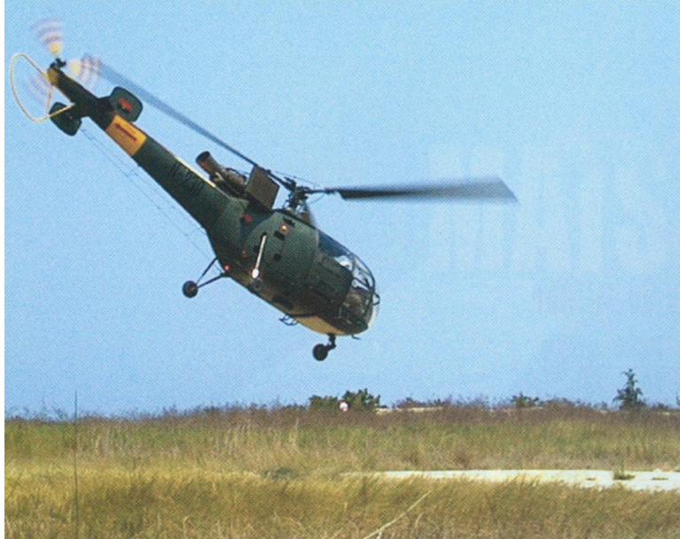
Missão de instrução em AL III