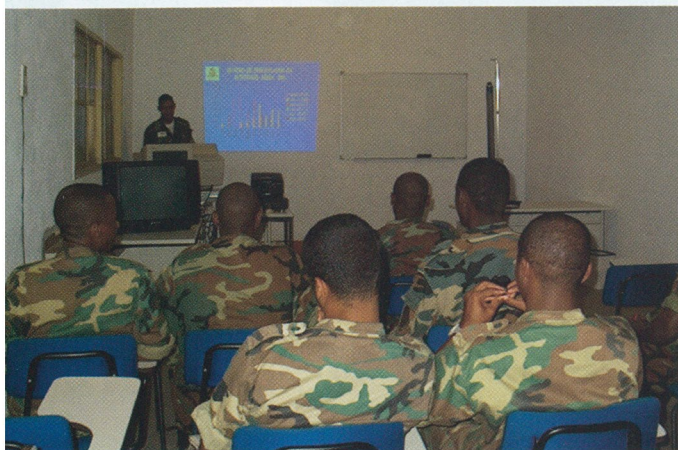
"Briefing" de Segurança de Voo

elementar, em 11 de Setembro de 2000 teve início a primeira parte do curso de helicópteros da FANA, a instrução teórica inicial ministrada aos cinco cadetes seleccionados. A Esquadrilha de Helicópteros, ("cátedra") deu início à instrução de voo, em 28 de Setembro de 2000, operando dois Alouette III. O primeiro "voo solo" teve lugar no dia 30 de Outubro e uma semana depois, já os restantes alunos tinham sido "largados" e devidamente "banhados", como manda a tradição!