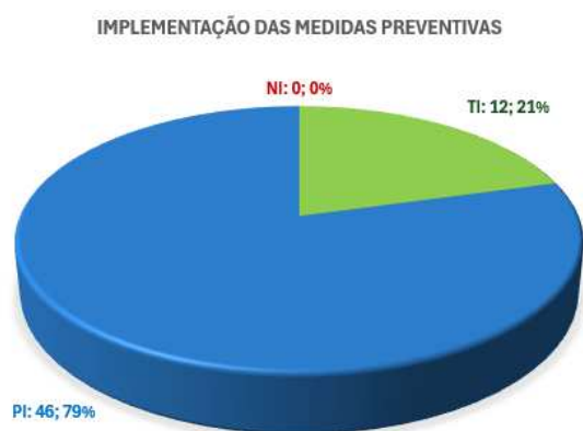
Gráfico 1 - Síntese da implementação das medidas preventivas e do grau de risco

No gráfico seguinte efetua-se uma síntese da implementação das medidas preventivas e do grau de risco definidos no âmbito do Plano de Prevenção de Riscos de Corrupção e Infrações Conexas atualmente em vigor.